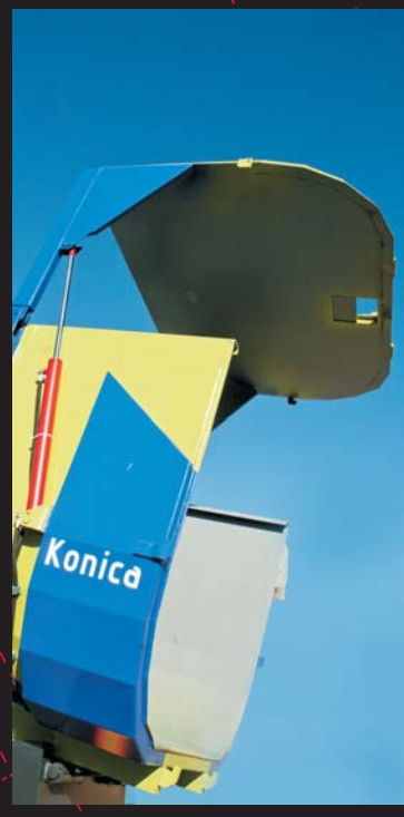
Puerta hidráulica corredera