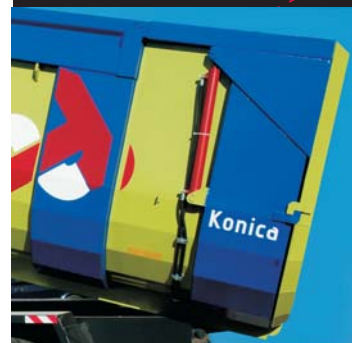
Lateral doble costilla

Es el modelo de remolque agrícola más versátil. Con una personalización dependiendo de sus necesidades laborales. Dispone de una amplia gama de detalles o accesorios, tamaños y colores para poder personalizar el remolque a su gusto. Todo ello con unos materiales de primera calidad, que hace al remolque a la vez de útil, duradero.