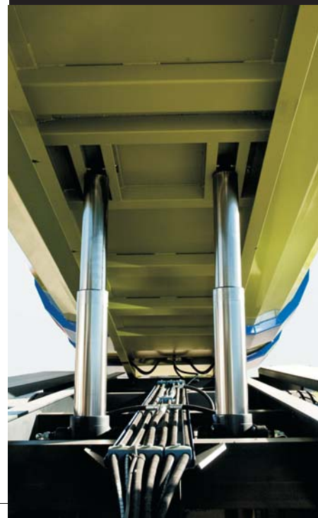
Lona apertura lateral